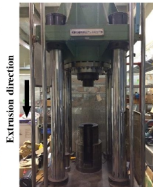
400トン縦型油圧プレス機