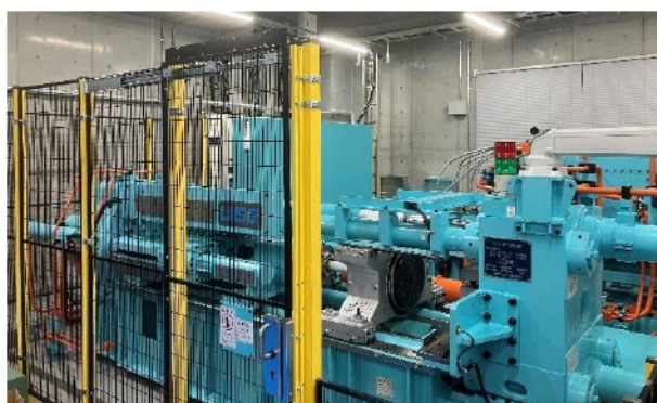
400トン直間複動横型押しプレス機