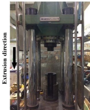
400トン縦型油圧プレス機